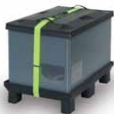
Gruppi di contenitori