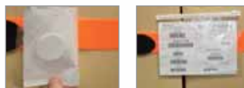
Sistema di identificazione