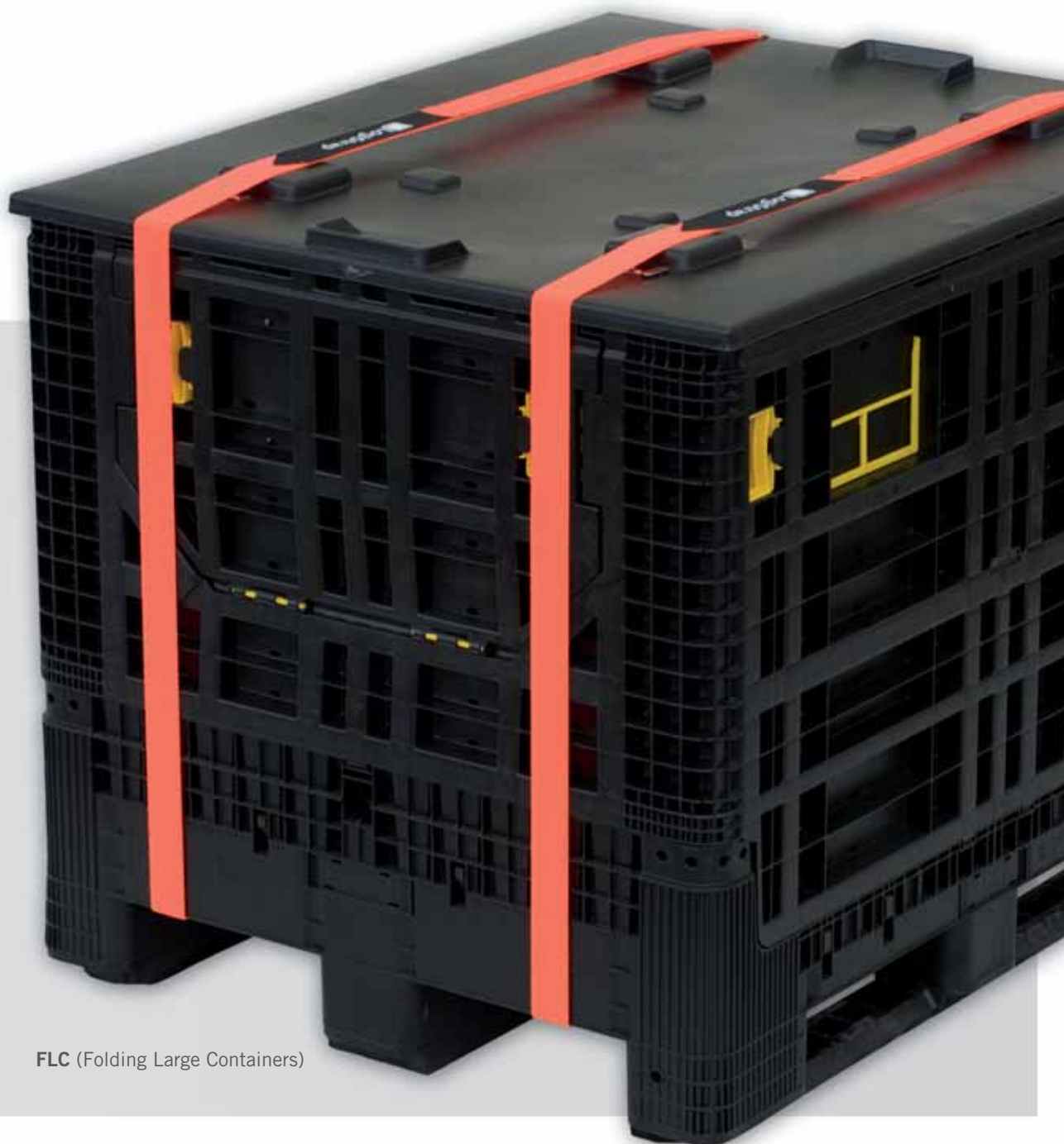
FLC (Folding Large Containers)